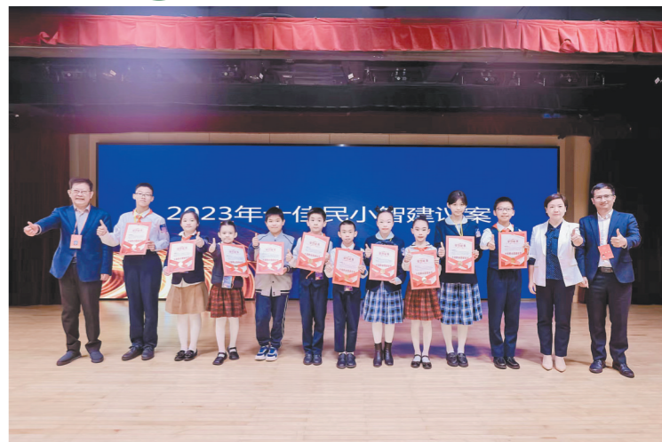
十佳民小智建议案揭晓