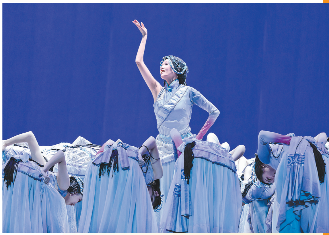
深港青少年以舞为媒,共同凝聚文化认同

为遴选出高品质的舞蹈艺术作品,主办方以作品的思想性、艺术性、科学性、健康性为审美导向,邀请深港地区和国内知名舞蹈艺术家、文化学者进行现场评审,决出最终入围作品参加展演及评奖。各类奖项旨在鼓励湾区优秀青少年舞者和舞蹈创作者,表彰为青少年舞蹈事业作出突出贡献并取得优异成绩的机构和个人。评审过程中,主办方还组织开展第二届“以美培元”高质量舞蹈美育创新实践与人才培养研讨会等交流活动。