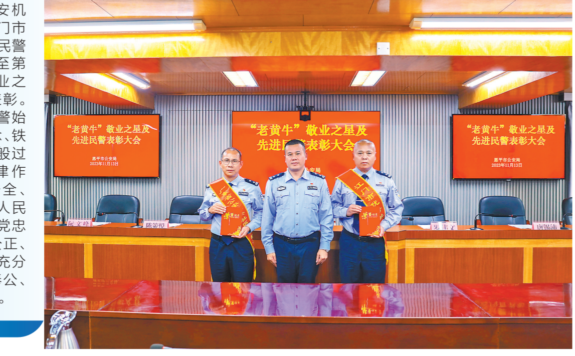
江门市2名社区民警荣获广东省公安机关社区民警标兵

日前，江门恩平市公安局举办警营先锋——“老黄牛”敬业之星和先进社区民警表彰大会，对今年荣获广东省公安机关社区民警标兵、江门市优秀社区民警的2名民警以及荣获该局第一至第三季度“老黄牛”敬业之星的6名民警进行表彰。据介绍，获表彰的民警始终以铁一般理想信念、铁一般责任担当、铁一般过硬本领、铁一般纪律作风，坚决捍卫国家安全、维护社会安定、保障人民安宁，忠实践行着对党忠诚、服务人民、执法公正、纪律严明的总要求，充分展现人民警察克己奉公、无私奉献的良好形象。