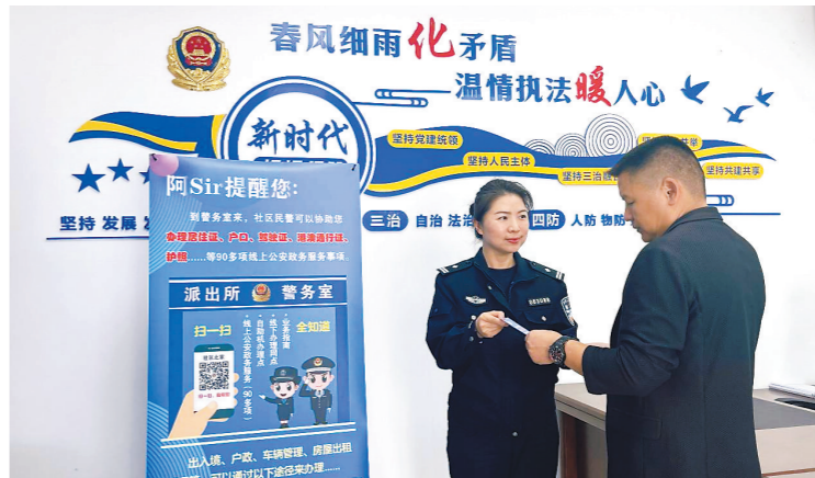
珠海公安民警指导港澳居民领取“粤居码”并在线申报居住登记

动有关职能部门主动对接珠海市政政局，通过港澳居民居住证服务接口调用，满足港澳居民居住证信息核查和验证需求。目前，港澳居民居住证在珠海市教育、就业、卫生、公共文化体育等领域广泛应用，持证人员可享受旅馆住宿、机动车登记、机动车驾驶证申领、生育服务登记等便利服务。 据介绍，截至2023年12月7日，全市有9万余名港澳居民网上预约办业务，发送到期换证提醒短信1.6万余条，有2.1万余名港澳居民通过“珠海市公安局和出租屋信息管理系统”微信小程序登记申报信息。