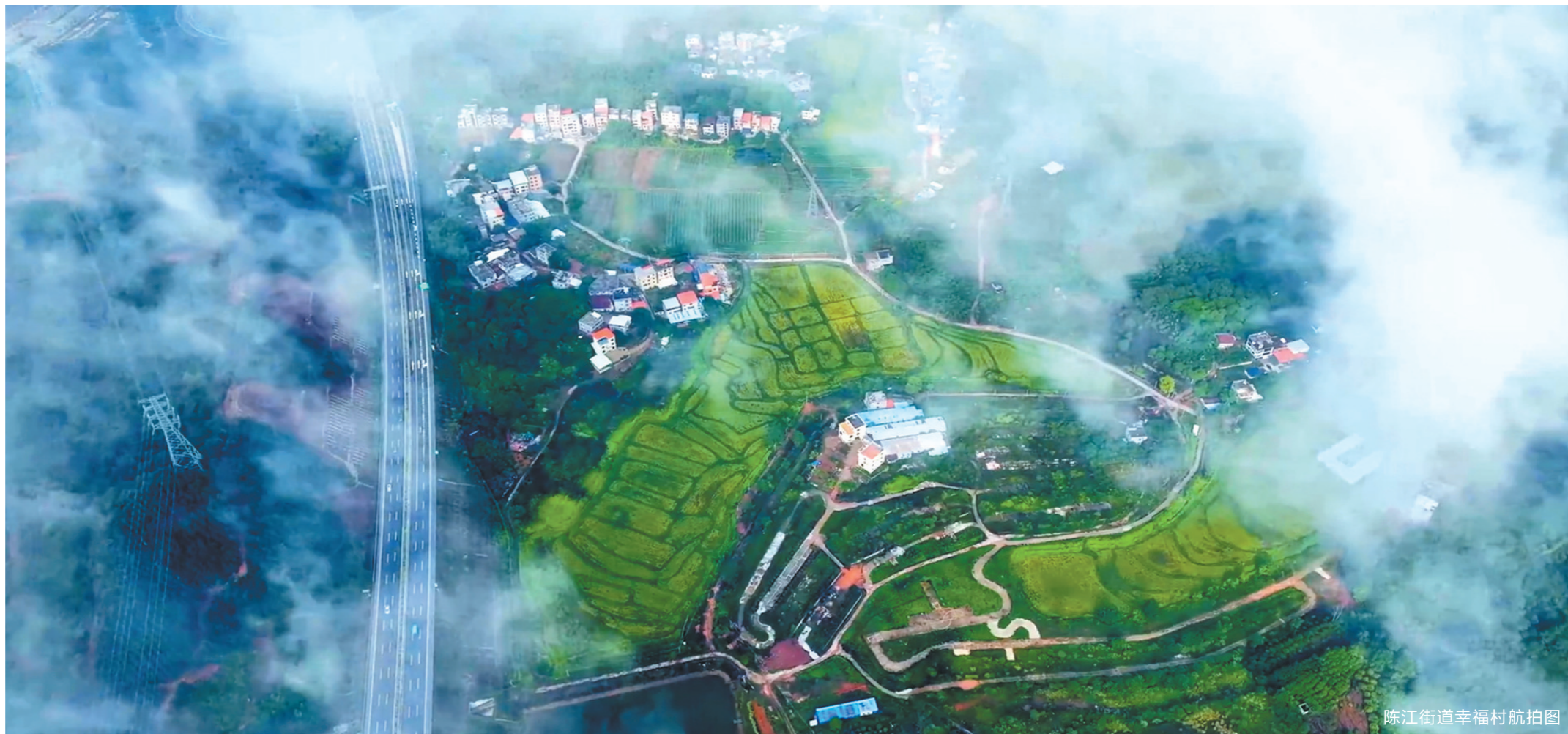
陈江街道幸福村航拍图