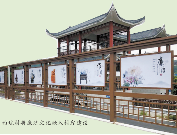
西坑村将廉洁文化融入村容建设