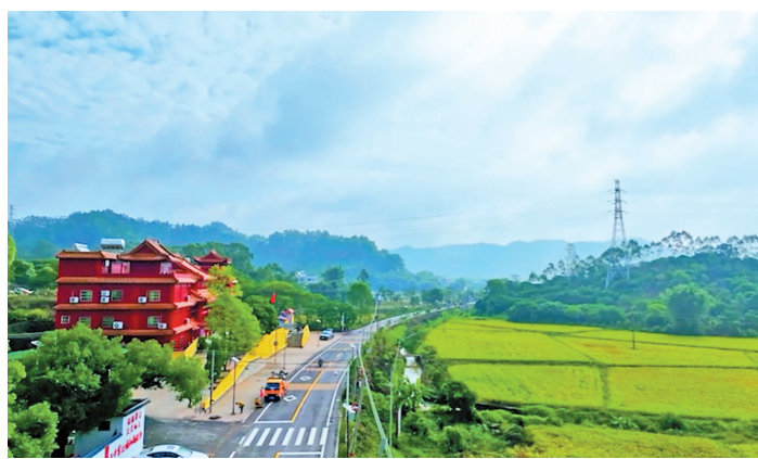
幸福村村道整洁，绿化郁郁葱葱

随着走进幸福村，村委会旁一条被称为“幸福绿道”的绿色景观长廊格外吸引眼球，全长约15公里的绿道边绿树成