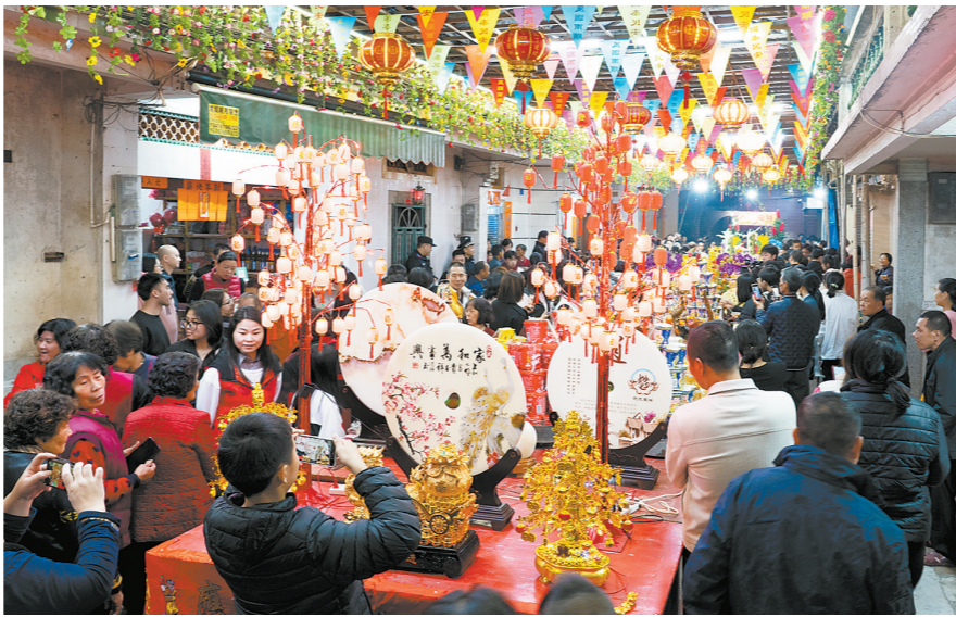
正月十六晚，平海古城北门的摆盘现场热闹非凡，人潮涌动

近年来，平海摆盘备受人们的喜爱，已成为平海古城的一道靓丽风景线。同时，这项传统民俗活动也逐渐受到当地年轻人的关注，并且积极投身参与其中，不仅在形式上更富有创作艺术性和生活气息，还在创新与传统碰撞中接力传承。