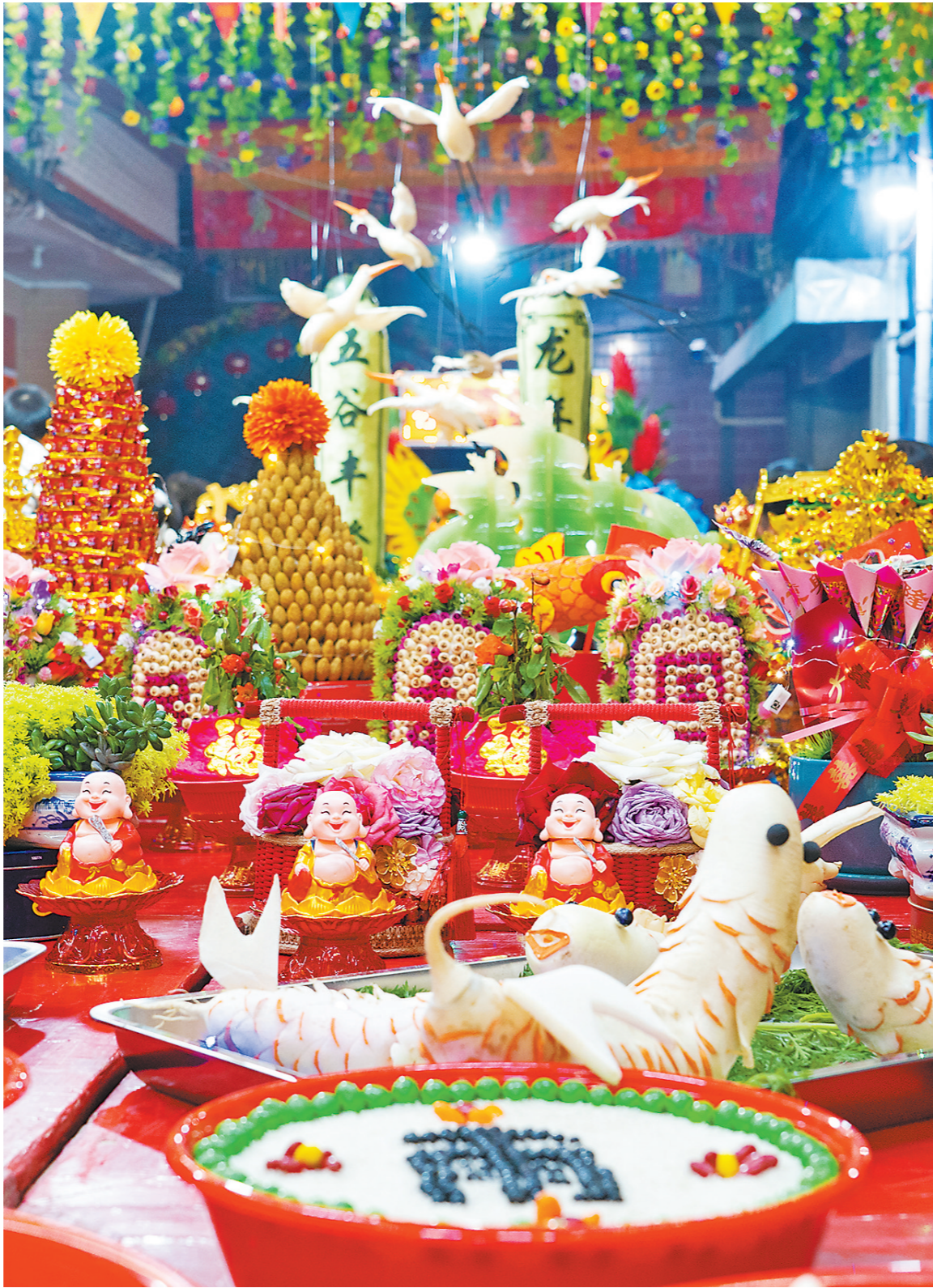
摆盘现场有各式各样的摆件

每年农历正月十六，惠东县平海古城内的北门大街都挂满彩旗，红桌子从街头摆到街尾，桌上摆满村民精心制作的工艺品或是各类摆件，供人欣赏、点评。原来，这就是平海镇平海社区西北村一年一度的摆盘盛会。