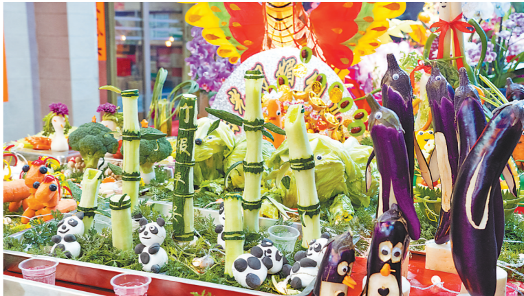
平海阳光明幼儿园的37位老师共同制作的摆件，以学校名义参加摆盘

据了解，平海镇除了平海社区西北村有摆盘外，社区内的西元村也保留着这个民俗，只是时间上略有不同，分别是农历正月十六和正月二十。