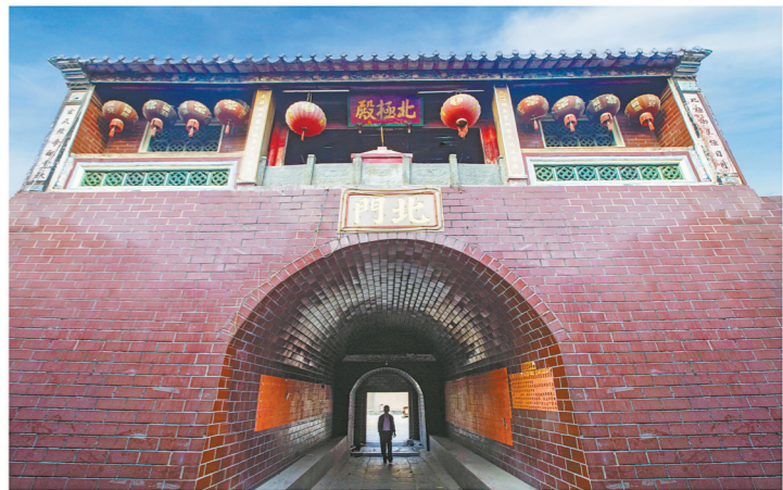
惠东县平海古城内的北门至今保存完好