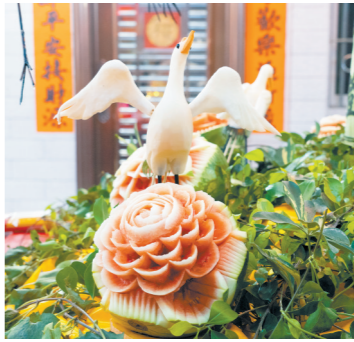
用白萝卜拼接的白鹤栩栩如生，用西瓜精雕的红花剔透晶莹