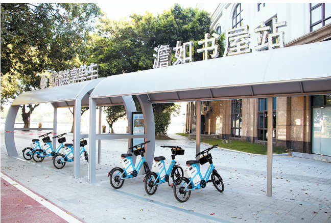
南海氢能共享两轮车

续举办更是不断提升着容桂渔人码头的口碑和人气。据了解，2023年容桂渔人码头共接待游客295.26万人次。不久前的元旦、春节，容桂渔人码头接待游客22.2万人次，同比上升104.6%，更是首次超过逢简水乡和清晖园，成为仅次于华侨城欢乐海岸和顺峰山公园的顺德第三大旅游景区。 实际上，在整个顺德被称为渔人码头的景点远不止一个。在容桂渔人码头成功出圈后，陈村渔人码头·千禧坊、伦敦渔人码头·C立方相继面向大众营业。