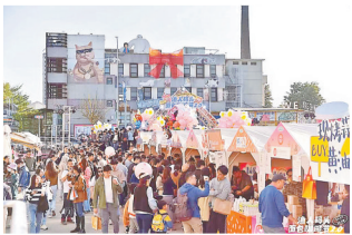
伦敦渔人码头举办面包咖啡节