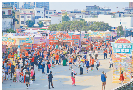
顺德容桂马松松美食嘉年华

“近年来，工业旅游作为文旅产业的新热点逐渐广为人知，佛山作为制造业大市，拥有较为良好的文旅资源和发展工业旅游的基础。”中国晚报协会学术委员会副主任、广东省文化学会会长、广东省政府参事室特约研究员周建平表示，佛山可以从进一步整合旅游资源、注重游客体验、提升工业旅游品牌知名度、加强政策扶持、培养专业人才等多个方面重点发力，走出具有佛山特色的工业旅游发展之路。 周建平表示，佛山应该尽快建立全市工业旅游行业标准，以规范性政策引导，重点打造全市“龙头型”工业旅游品牌项目，加快建设工业旅游产业集群，推动工业旅游产业科学发展。 他还建议，工业旅游要善于用文艺形式讲好故事，要走出“光游不买企业不愿意；看看流水线游客不愿意”的困境，要在参观企业、展馆的基础上，引入更多“文化体验感”，让游客不单只是了解企业的发展史、车间的生产工艺，而是更多地感受到集中展示某个产业培育、发展、壮大的演化过程，“以有特色、有特点的动人故事作为引子，让游客身临其境感受产业发展魅力”。