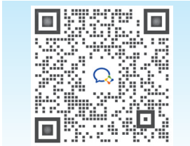
有问题问德叔团队？扫码入群可提问

功效：疏肝解郁，补脾养胃。烹制方法：大米、小米洗净，浸泡30分钟；佛手洗净泡软切细丝，山药去皮切小块备用。砂锅内放入大米、小米、山药，加入适量清水，大火煮开，转中火煲30分钟，再加入佛手丝煮5~10分钟即可。根据口味加入适量冰糖或盐调味。此为两三人量。