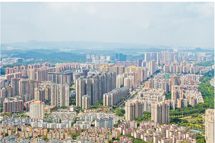
东莞城市中的诸多住宅小区（资料图）

称《条例》），对业主和业主组织的权益、物业管理服务的要求、物业的使用和维护规范等多方