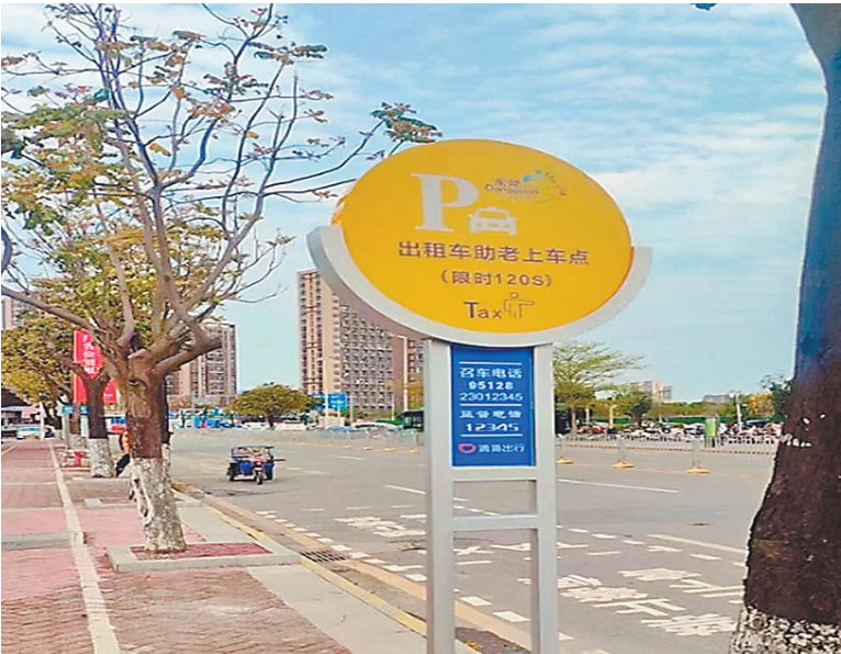
虎门出租车助老上车点

羊城晚报讯 记者余宝珠摄影报道：老年人出行打车难题如何破解？记者4月11日从东莞市交通运输局获悉，东莞虎门优化调整出租车停靠点，通过优化升级新的功能，进一步实现“助老打车”。