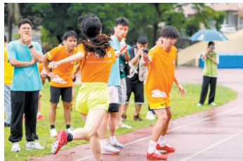
广东科技学院2023年运动会（资料图）

该项目构建以公共体育课程为基础、以体育类社团为依托、以日常锻炼和体育训练竞赛为抓手的新时代“体健融合”育人模式。通过开展课程教学、课外活动、体育竞赛、课题研究等方式，深入推进“体健融合”项目系列活动。同时，利用心理健康测评、体育健康监测等前沿技术，动态掌握和评估学生身心健康状态，及时分析“体健融合”活动的实施效果并形成研究报告和育人案例，探索高校“体健融合”新模式、新路径、新经验。旨在优化体育、心理健康教育内容结构，提高体育、心理健康教育课程育人质量；推进“体健融合”实践探索，丰富校园文化活动，培育“体健融合”品牌；发挥试点引领示范作用，推动项目发展和普及。 一直以来，广东科技学院坚持健康第一的教育理念，深化学校体育、心理健康教育体系改革，先后培育了篮球、足球、排球、定向越野、体育舞蹈等体育品牌项目，举办阳光体育文化节、田径运动会等体育活动。其中，2016-2023年学生参加省级以上体育竞赛获奖共327项，其中获得国际奖