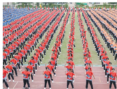
东莞学位持续增加

民生无小事，事事系民生。在东莞这座充满活力的城市，发展不仅是经济的腾飞，更是民生的持续改善。今年以来，东莞政府不断创新举措，坚持在发展中保障和改善民生，聚焦学位、医疗床位、停车位、养老床位、就业岗位“五位”难题，着力解决群众身边的操心事、烦心事、揪心事，让市民真切感受到了“质”变莞邑的温暖与力量。