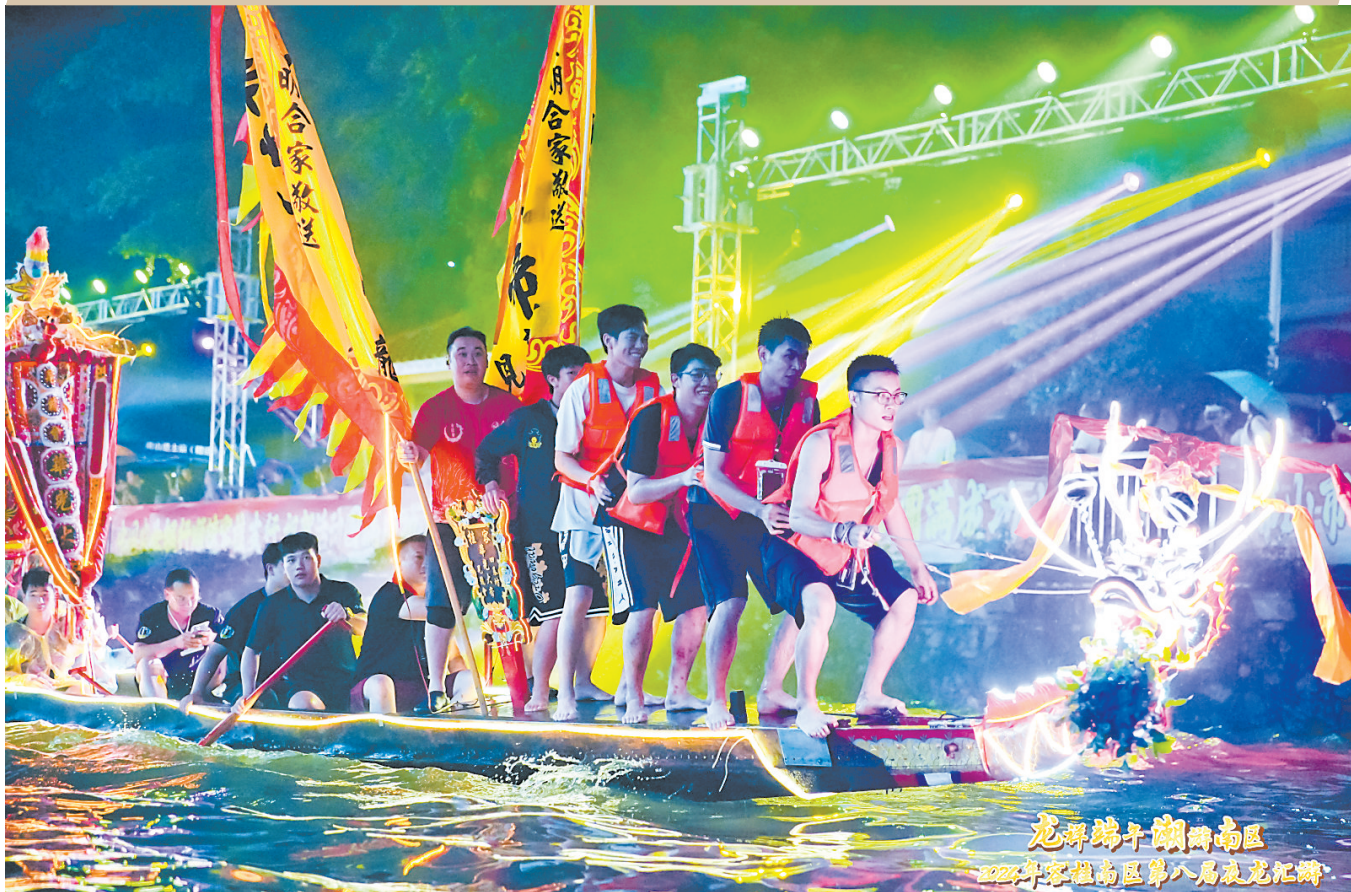
伴随音乐鼓点，船手们上下跃动“摆”动船身

在《顺德县志》中曾记载：“赛事通常在五月初一开始，形式有两种：一为‘趁景’，又名‘出游’，一为‘斗标’，又名‘竞渡’，前者侧重表演技巧，龙船大者长达十丈八丈，可坐七八十人，出动时安上木雕漆彩的龙头龙尾，插彩旗罗伞，并各有铜锣和大鼓，按锣鼓节拍划动……” 在文献中提到的“趁景”即是各村龙舟巡游，探亲访友。去亲戚朋友家走一转人都得是打扮得美美的，龙舟自然少不了。 色彩艳丽的罗伞、绣工一流的彩旗、庄严威武的龙头、龙鳞辉映的龙尾等构成了缤纷的彩龙，逐渐演变成当下的“彩龙巡游”“彩龙竞美”活动。