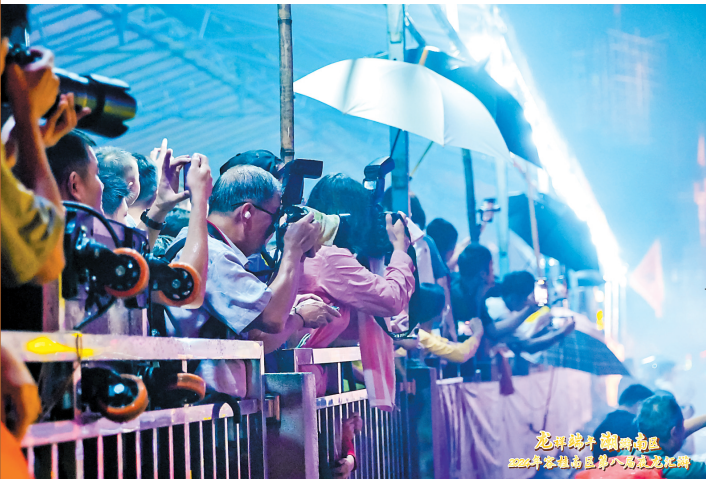
再大的雨也淋不灭市民游客看夜龙的兴致

地”，26个居村的62个民间坊社都拥有自己的龙舟。截至目前，容桂共有传统龙舟136艘、凤舟3艘。不仅如此，容桂在龙舟文化活动中有别样魅力，区别于其他地方的“竞速”，更注重“比美”。无论是夜龙汇游、彩龙巡游，抑或是岸上巡游等活动，都能很好地激发群众对传统文化的兴趣和传承。 更重要的是，本土龙舟文化承载着容桂人的乡土情谊，容桂各大坊社端午期间以龙舟巡游的方式相互拜访，让彼此之间的连接变得更加紧密，增强凝聚力。 从一盏白炽灯，变成现在的炫酷的彩灯，登上龙舟的主力手从60后变成90后00后。时至今日，千年龙舟在不负热爱、敢想敢干的顺德人手中，从普通的交通工具蜕变成表达时代潮流、展示时尚活力的夜龙，老龙们焕发着新生机，让大众看见龙舟的另一种可能。能够不断吸引着新世代靠近、喜爱的龙舟文化，何尝不是一种历久弥新的珍世之宝？