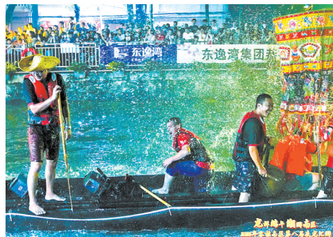
▲波水、大笑，夜龙汇游超欢乐