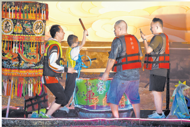
龙舟上一位父亲抱着孩子，让他尝试击鼓