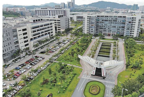
华新园集聚了300多家新材料企业

据悉,仅仅在华新园内部,通过企业之间的需求匹配和上下游撮合,每年新材料生态圈内部交易就超过了亿元。目前,华新园正在筹备第八届粤港澳大湾区新材料产业集群交易会,进一步促进生态圈内部企业、区域企业、上下游企业的交流交易,为粤港澳大湾区新材料产业集群的发展注入新的动力。