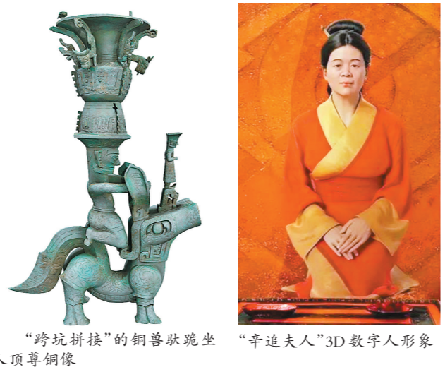
“跨坑拼接”的铜兽驮跪坐人顶尊铜像