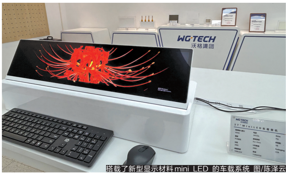
搭载了新型显示材料mini LED的车载系统

如果说新材料是先进制造业的“底座”技术,那么,以散裂中子源为代表的大科学装置则是“底座”中的“底座”。 在东莞的松山湖科学城群山之中,中国散裂中子源正是从一片荔枝林中“长”了出来。散裂中子源就像是“超级显微镜”,它以中子为“探针”,“看穿”材料的微观结构。从航空关键部件的金属疲劳到高铁车轮的寿命长短,从电动汽车的电池性能到高温超导材料的自旋涨落……散裂中子源为许多高能结构材料攻关提供了关键技术平台。