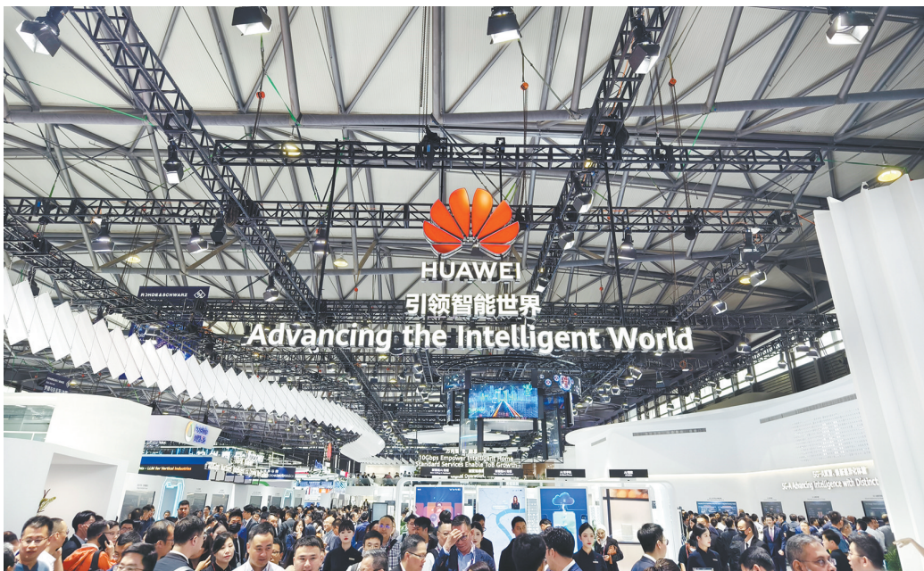
科技盛宴令人目不暇接