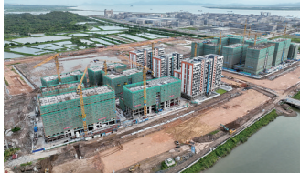
蓝领宿舍

在富山工业园二围北片区园区配套道路工程项目建设现场,也是一派热火朝天的景象。韶华路位于富山工业园二围北片区最南端,长度约1公里。在该路段施工现场,工人们顶着烈日认真操作着每道工序,