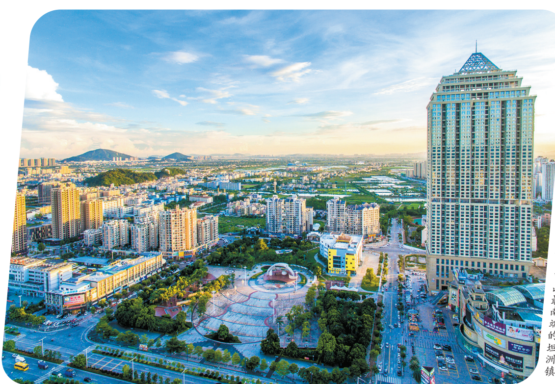
位于中山最南端的坦洲镇

《坦洲美食地图》精选了市民最喜爱的坦洲“十大名店”“十大传统美食”,囊括了特色美食街、品质商圈和果场农场。深中通道通车前夕,坦洲上线了H5《坦洲美食地图》,一经推出便得到广泛好评,不少人慕名而来,为人气大镇再添“一把火”。一图在手,寻味坦洲将变得更加有滋有味。