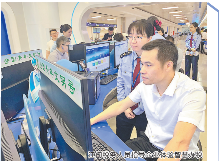
江门税务人员指导企业体验智慧办税

记者28日获悉,近日,江门市制定并印发《江门市打造一流营商环境实施方案(2024年版)》(以下简称《实施方案》)。《实施方案》包括5方面34条任务措施,突出“优无止境”,以年度为周期滚动更新作为营商环境改革推进机制,有节奏地进行迭代更新,加快改革进