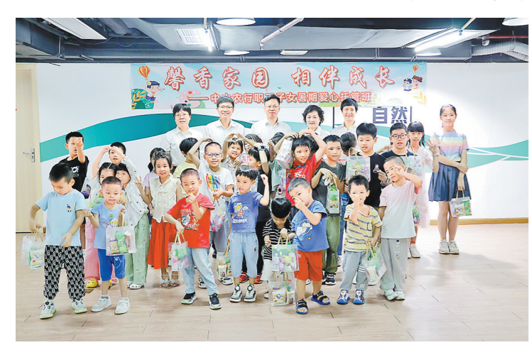
职工子女暑期爱心托管班结营

下一步,农行中山分行将努力把“爱心托管”打造为一项具有品牌影响力的服务项目,进一步总结深化员工关爱行动,全心全意为职工解难事办实事,切实将工会组织的温暖送到职工的心坎上,提高员工归属感,增强企业凝聚力。