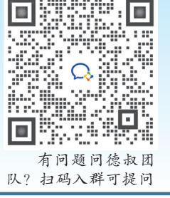
有问题问德叔团队？扫码入群可提问

材料：乌骨鸡半只，当归10克，陈皮3克，党参15克，红枣（去核）2—3枚，枸杞10克，生姜3—5片，精盐适量。功效：温中散寒养血。烹制方法：诸物洗净，乌骨鸡切块，放入沸水中焯水；上述食材一起放入锅中，加清水1750毫升（约7碗水量），武火煮沸后改文火煲1.5小时，加入适量精盐调味即可。此为2或3人量。