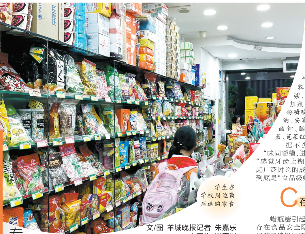
学生在学校周边商店选购零食