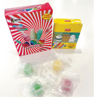
记者在小学周边小卖部买回两款蜡瓶糖

9月7日—10日，记者走访广州市天河区、广州市越秀区、佛山市南海区的八所小学，其中在四所学校附近的小卖部和文具店内都看到蜡瓶糖的身影，更有门店将它放在了较为显眼的位置，每盒的价格为1元—2元。据一些店铺老板透露，蜡瓶糖在小学生当中销量较好，部分款式的蜡瓶糖早就已经卖完了。有老板告诉记者，蜡瓶糖早在上学期在小学生当中就已经比较火了。一名在佛山上学的六年级学生告诉记者，班里有五六个同学都吃过蜡瓶糖。当记者询问他知不知道蜡瓶糖是用什么做的、有没有什么影响时，他回答：“用蜡做的，具体的不太清楚”。记者在某电商平台搜索关