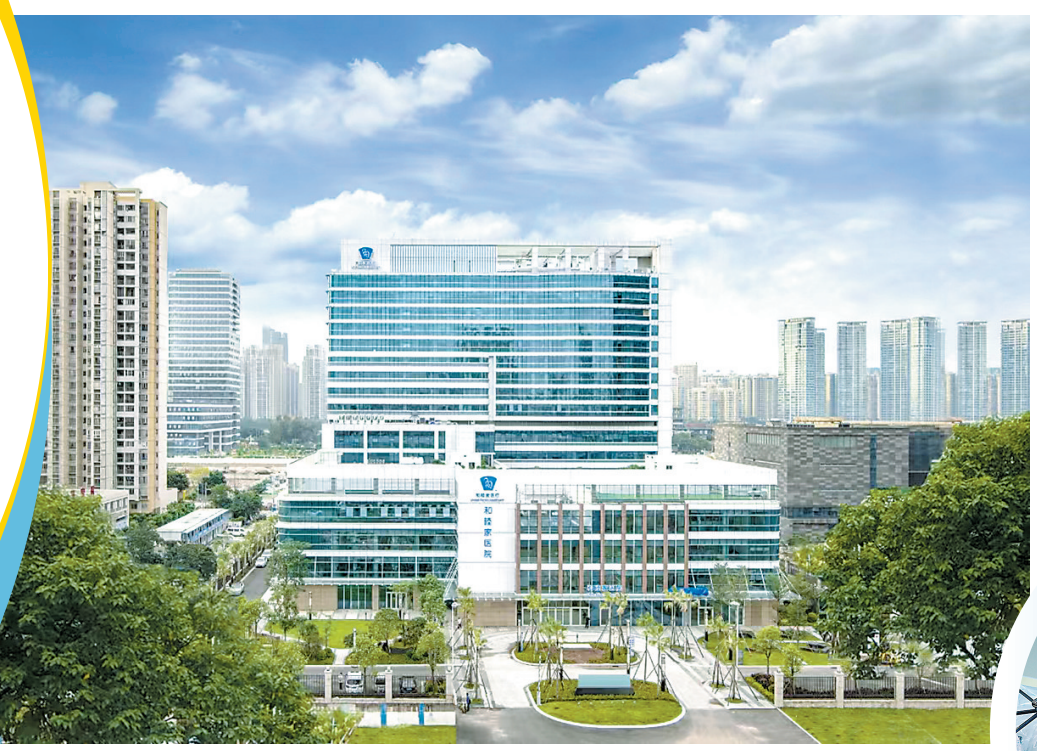
▲广州和睦家医院 ►MAKO机器人手术

9月12日是广州和睦家16岁“生日”。青春象征着活力与潜力，正如一位16岁的青年，广州和睦家在其成长的16年中，以蓬勃的生命力和不懈的创新精神，成为了医疗行业的佼佼者。“以患者之心为心，以患者之需为需”的理念贯穿于医院每一处细节的雕琢，用心提升医疗质量、创新服务模式。这16年里，广州和睦家门诊服务人次超60万，60个专科及亚专科/特色中心全面铺开，“零加成”引进11种临床急需、国际最前沿的药械，累计献血量高达30多万毫升……每一个数字都代表着医院对患者健康的关注和生命尊严的尊重。医院的每一步发展，也与广州这座城市的脉搏紧密相连，共同书写着一段段温情的故事。广州和睦家正以青春的姿态，迎接每一个挑战，用品质医疗守护着患者的健康未来。