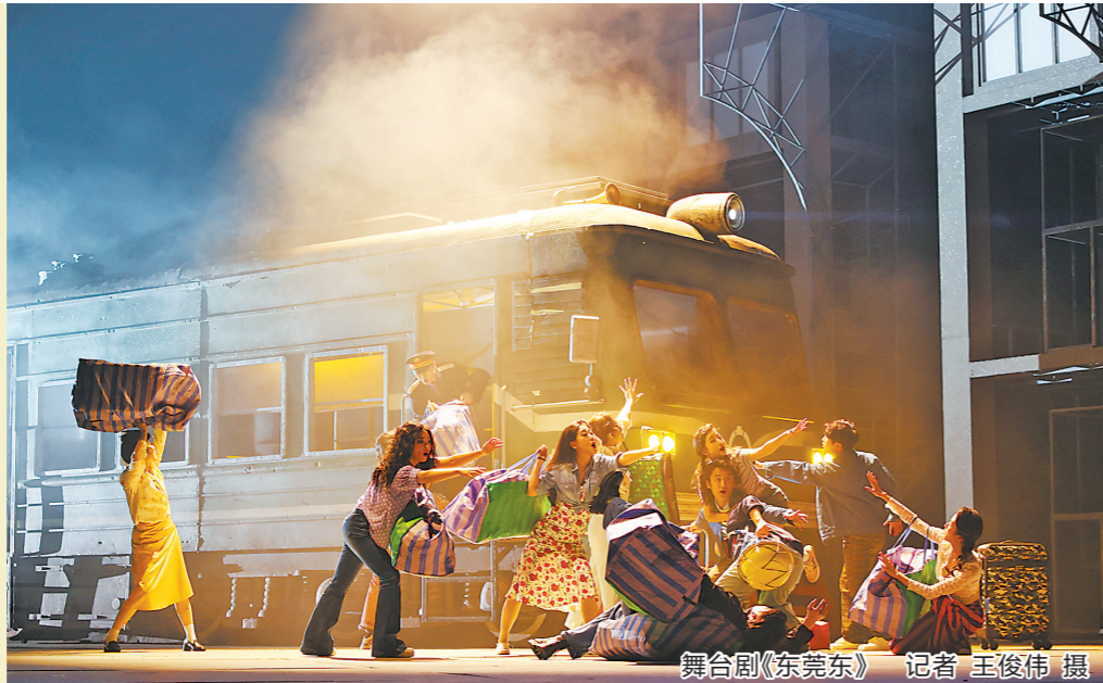
舞剧《东莞东》