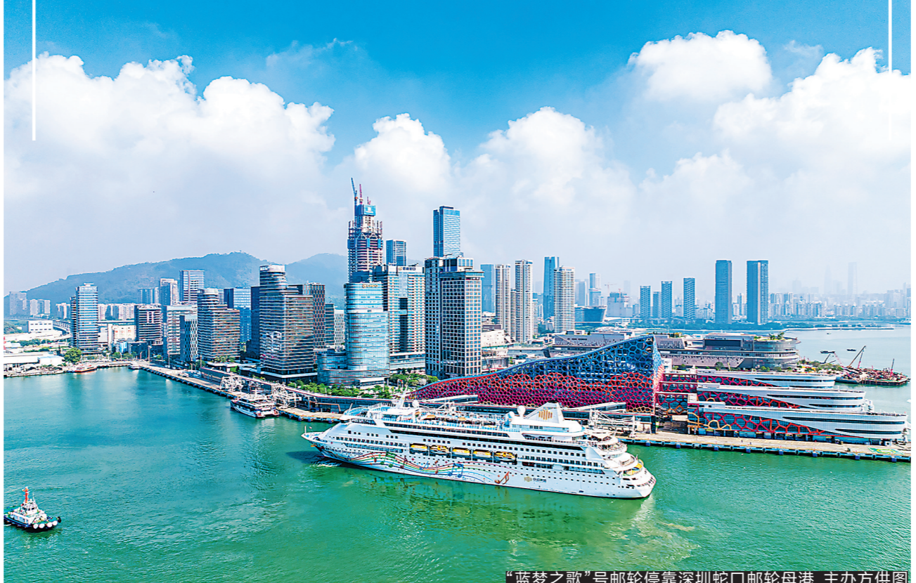
“蓝梦之歌”号邮轮停靠深圳蛇口邮轮母港

据介绍，在《深圳市港口与航运发展“十四五”规划》等政策文件的引领下，蓝梦邮轮积极响应，将业务发展重点转向南方，并于9月26日开启了其在深圳航季的序幕，于金秋时节运营多条特色航线，并致力于提升船上的广粤本地美食和文娱互动体验。通过打造高品质的文化旅游体验和优质服务，为粤港澳大湾区的邮轮爱好者带来更加多元和丰富的海上乐活之旅，进一步推动大湾区邮轮文化的高质量发展，为邮轮经济文化的进一步融合注入新活力。