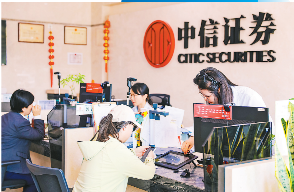
个人投资者在券商营业部办理开户业务

北向资金的第一大重仓行业为电力设备行业,第一大重仓股为贵州茅台。此外,截至9月30日,北向资金十大重仓股分别为贵州茅台、宁德时代、美的集团、长江电力、招商银行、迈瑞医疗、中国平安、汇川技术、国电南瑞、紫金矿业。其中,对贵州茅台持股市值超过1500亿元,对宁德时代持仓市值超过1200亿元。