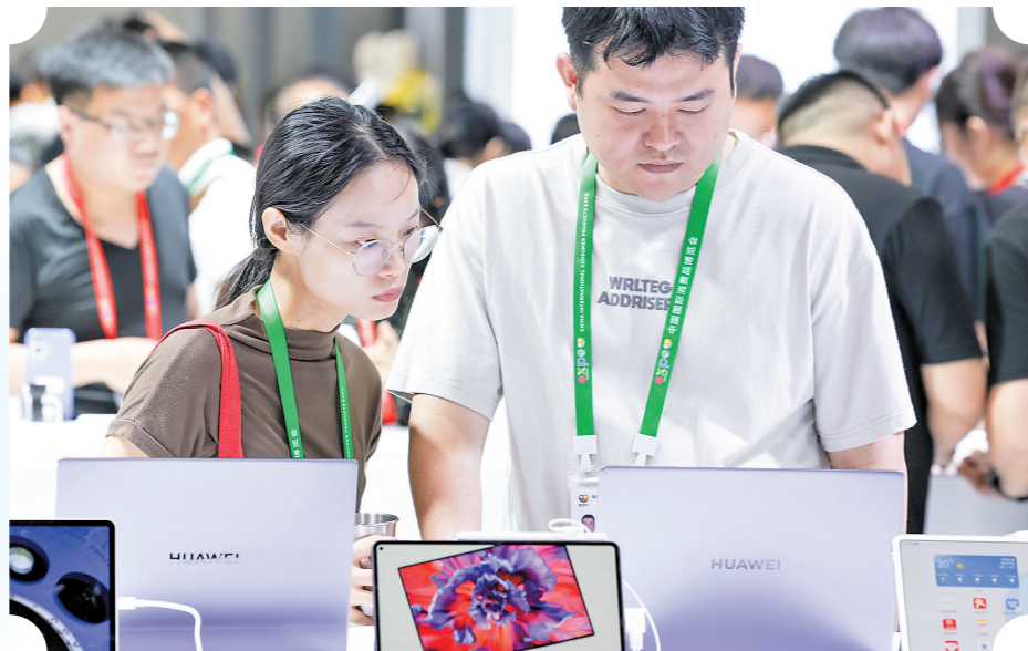
观众在华为展台参观

今年,全国工商联组织开展第26次大规模民营企业调研,共有9642家2023年营业收入5亿元以上的企业参加,其中营业收入前500位的企业为2024中国民营企业500强。记者梳理“2024中国民营企业500强”榜单发现,500强企业入围门槛达到263.13亿元。在中国民营企业500强榜单中,有50家粤企上榜。