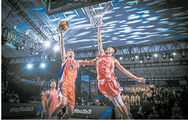
国际篮联三人篮球公开赛

此外，上海安普科技队有两名队员为塞尔维亚籍，薪火阵营队、香港康智医疗队、东莞万汇图队以及东莞三狼体育队均有一名外籍球员。