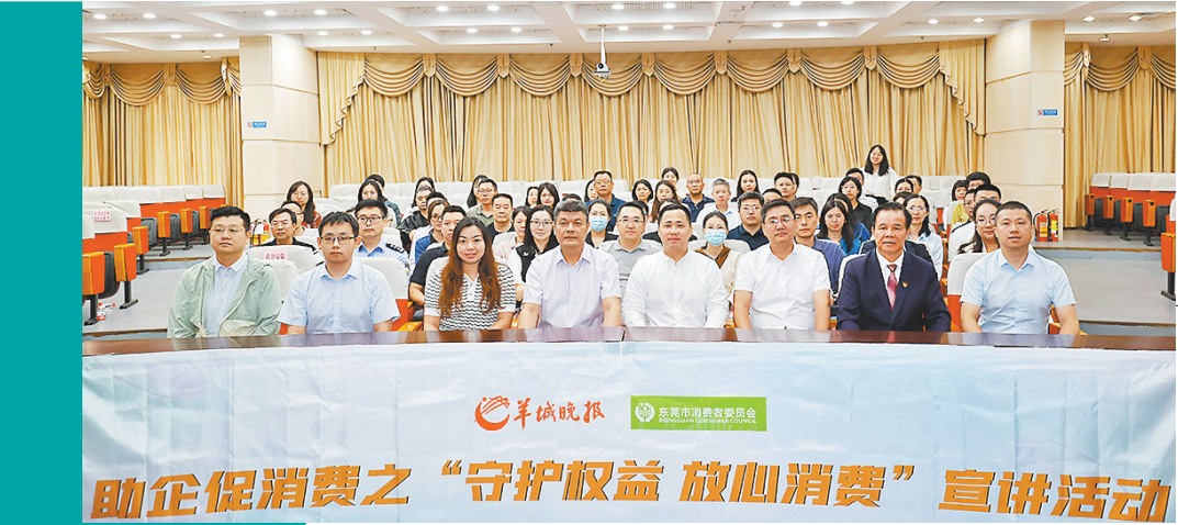
协会代表、企业精英生动讲述权益守护精彩故事