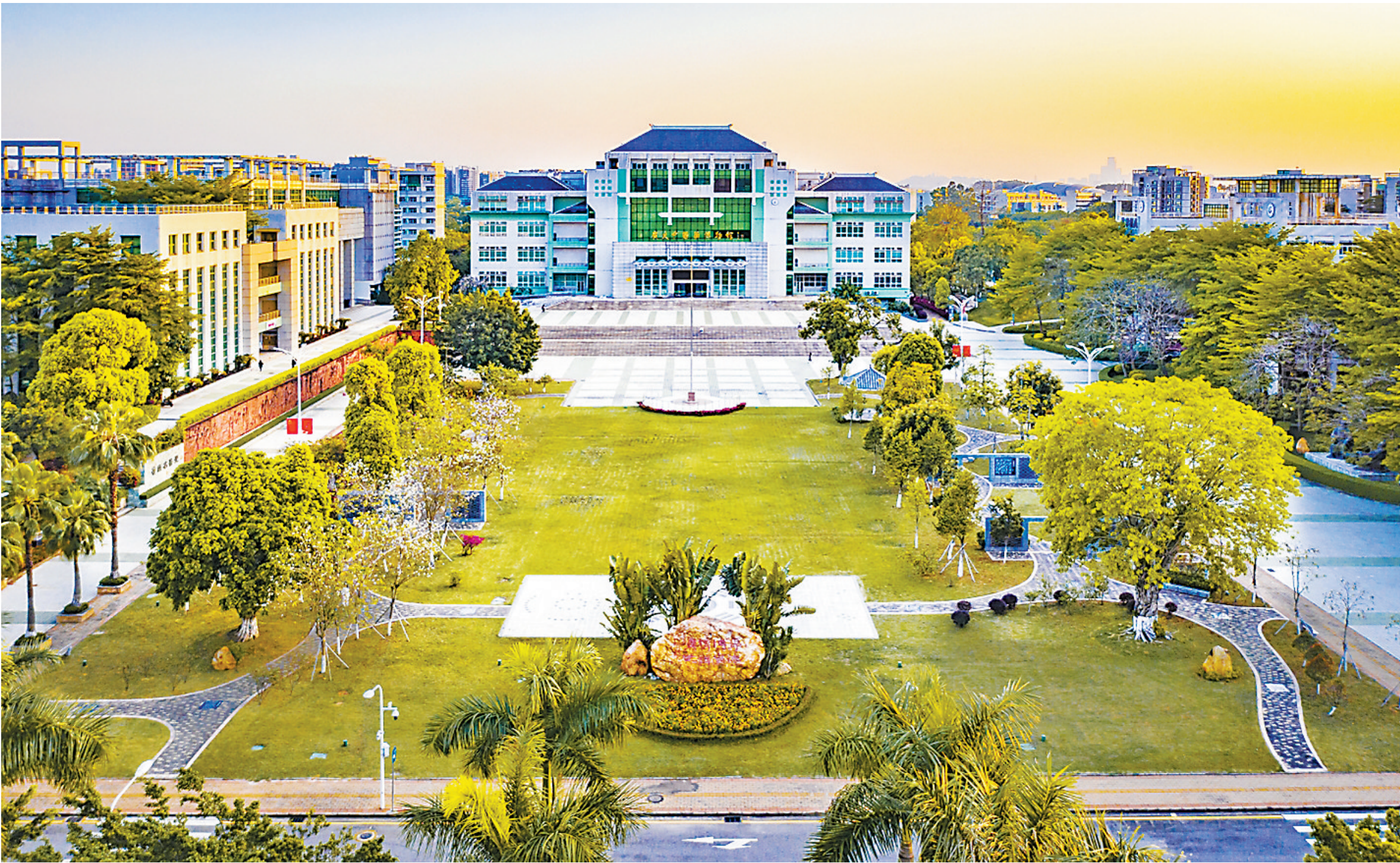
广中医大学城校区