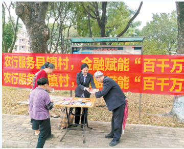
农行东莞分行服务镇村居民

以农行广东省分行与东莞市政府签署金融支持东莞高质量发展全面战略合作协议为抓手,农行东莞分行逐项细化任务清单,精准服务支持,推进协议有效落地。该行针对重点企业、重点园区、重点行业,灵活实施“点+链+圈”