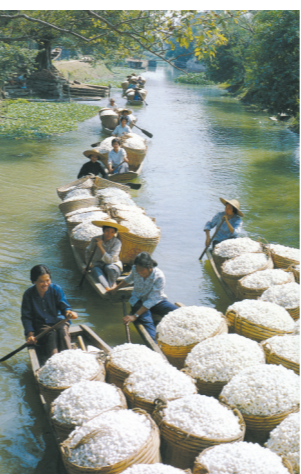
南海西樵曾创造“一艇生丝去 一艇白银回”的辉煌