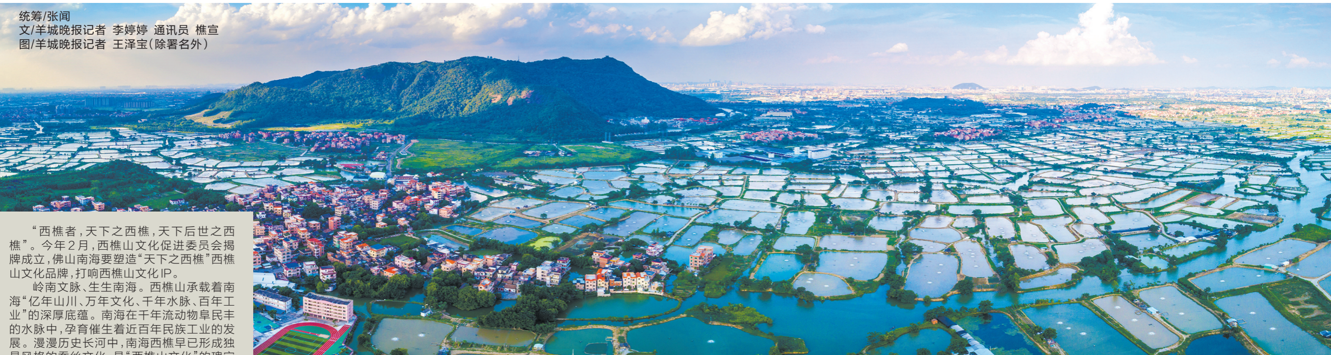
桑园围成功入选“世界灌溉工程遗产”，西樵镇位于桑园围核心区

统筹/张闻 文/羊城晚报记者 李婷婷 通讯员 樵宣