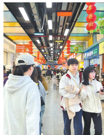
广州一商圈人流如织

开展优化消费环境三年行动 一直以来，广东省致力于积极营造安全放心消费环境，严守底线，切实保障消费环境安全。在深化民生领域广告治理方面，查处医疗服务、药品、教育培