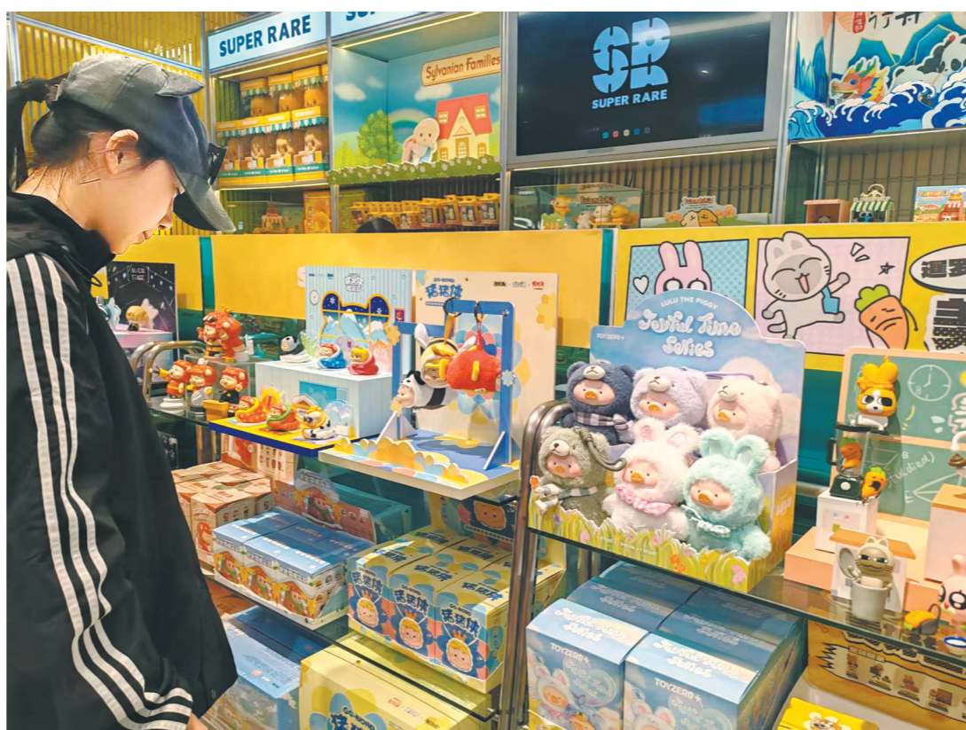
二次元周边商品受到欢迎

据艾媒咨询发布的《2024-2025年中国谷子经济市场分析报告》显示，2024年，中国“谷子经济”市场规模达1689亿元，较2023年增长40.63%，预计2029年将超