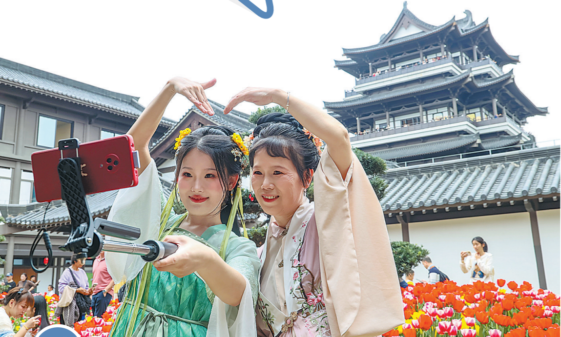
市民在广州市文化馆新馆踏青赏花

华南师范大学旅游管理学院教授李军认为，通过专项资金精准滴灌乡村文旅项目，将为乡村振兴装上“双引擎”。像南昆山下的民宿集群、潮汕工夫茶体验工坊等将进一步讲好“老手艺遇见新经济”的故事。正是政策红利的密集释放与地方实践的创新突破，共同勾勒出一幅“一业兴、百业旺”的广东乡村旅游产业图景。