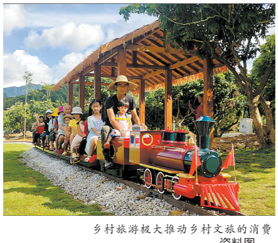
乡村旅游极大推动乡村文旅的消费 资料图