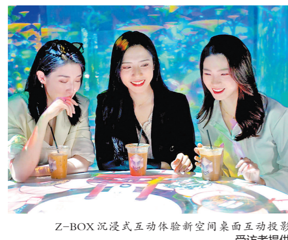
Z-BOX沉浸式互动体验新空间桌面互动投影

工作报告提出，实施提振消费专项行动。落实和优化休假制度，释放文化、旅游、体育等消费潜力。完善免税店政策，推动扩大入境消费。培育壮大新兴产业、未来产业。开展新技术新产品新场景大规模应用示范行动，推动商业航天、低空经济等新兴产业安全健康发展。