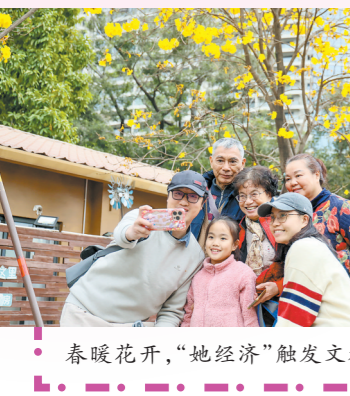
春暖花开，“她经济”触发文旅消费

“比起传统的吃、穿、用等消费，新一代女性，越来越愿意把钱花在‘看不见的地方’。”三月春始来，万物复苏季。在“三八”国际劳动妇女节期间，不少女性将本月视为出游月，将要或已经安排了一场心仪的短假。去哪儿大数据研究院分析，这一届女性消费者奉行“只为自己而行”，她们舍得为“无形的体验”和“情绪价值”买单，旅行成为其首选的选项。