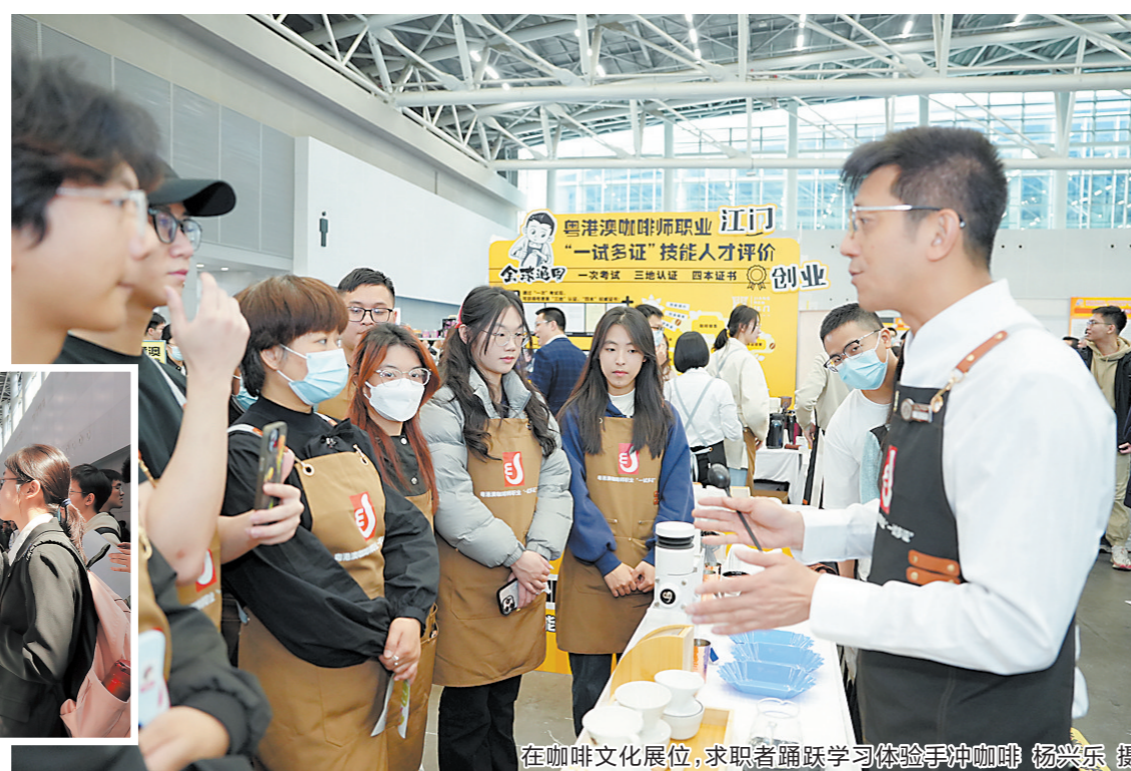
在咖啡文化展位，求职者踊跃学习体验手冲咖啡

其中，广东嘉士利食品集团有限公司带来高薪岗位，年薪高达500万元，吸引诸多求职者驻足。“这是集团总经理岗位。我们希望能招到有真才实学的人，带领企业再上一个台阶。”该公司人力资源负责人余晓娟表示，近年来，公司快速发展，生产规模不断扩大，人才需求也不断增加，今年招聘管理和技术岗位的人才比往年多。