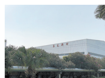
珠海长先新材料科技股份有限公司

长先新材在绝缘材料领域也实现了三级跨越式发展。其自主研发的CX936水性绝缘漆以B级成本实现F级溶剂型绝缘漆性能，耐温指标突破155℃，VOC排放降低95%，成功占领华南市场。此外，长先新材研发的光伏助焊剂也是该细分领域的单项冠军。