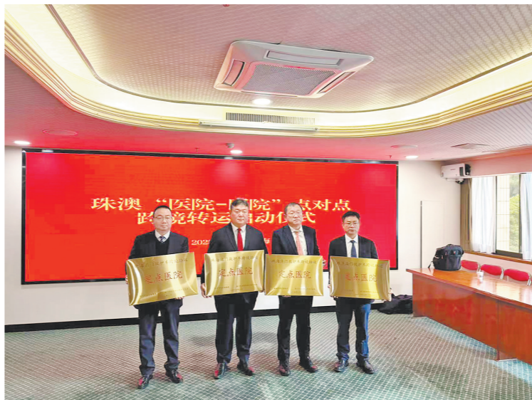
澳门仁伯爵综合医院与珠海四家医院开通救护车点对点跨境转运服务

“所有转介患者均提供绿色通道服务，诊疗服务前移，院方协助建立患者诊疗档案，结合患者病情提前制定合适的检查方案并开具医嘱，让患者‘少跑路’，免除就诊或入院前各项流程的办理，实现转介患者到院直接就能到达就诊目的科室，能较好地减轻澳门患者因诊疗环境不熟悉所带来的就诊压力，大幅提升了患者就诊体验感，从而吸引更多澳门转介患者来院就诊。”崔敏表示，“医院目前承接为澳门科大医院培养急诊科医师的任务，同科大医院急诊科医师的培养、急诊医学专科医联体合作、三大中心（胸痛中