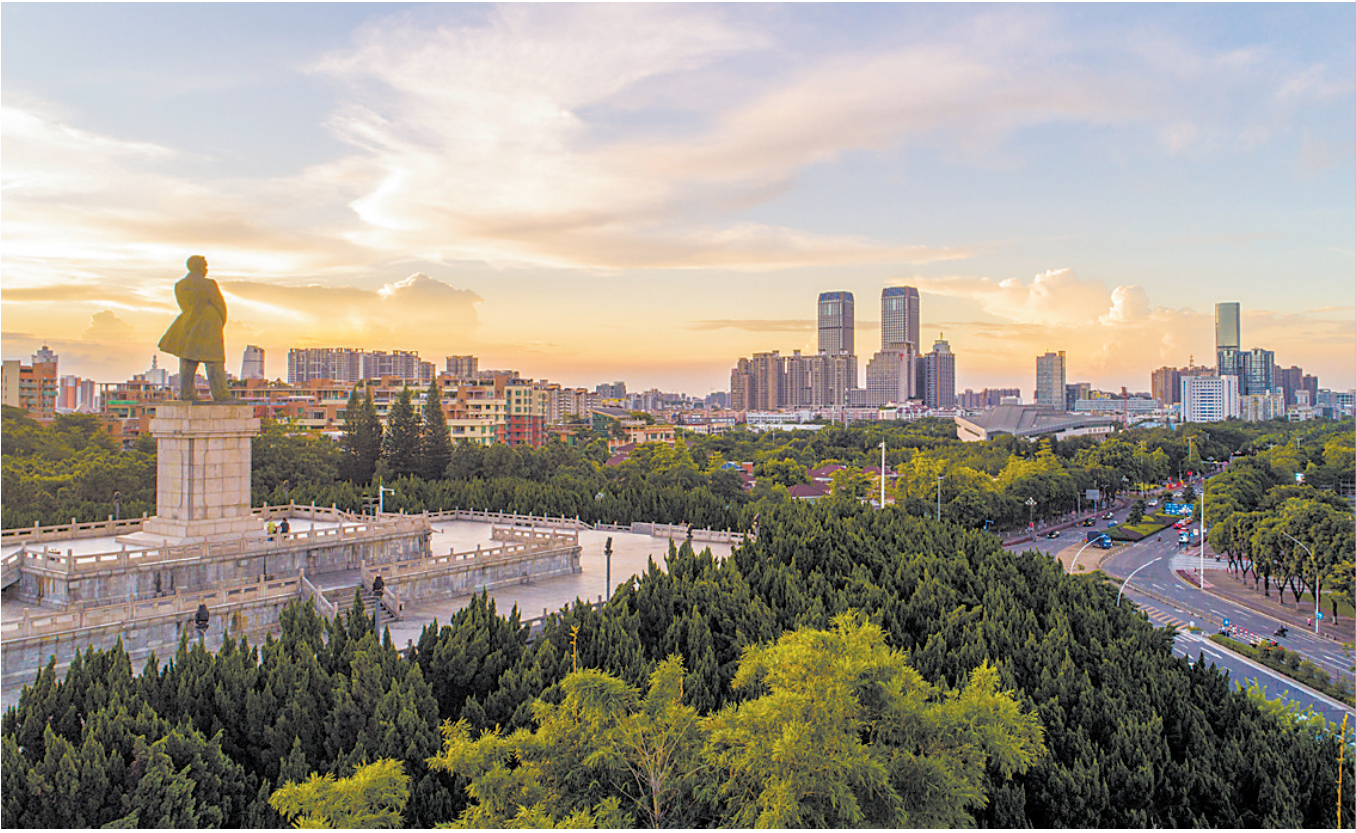
中山实施城乡形态升级行动，打造美丽公园体系，塑造中山城市新名片，图为中山市孙文纪念公园一带的城市风景

近年来，中山以头号力度推进“百千万工程”，锚定“经济强、城乡美、社会治，奋力实现城乡协调共同富裕”目标，打响了转作风、低效工业园改造升级、水污染治理三大攻坚战，重振干部队伍精气神，重塑产业发展空间，重现岭南水乡风貌，全市高质量发展面貌一新。面对新的发展要求，中山选择以内涵式发展、集成式改革的方式，闯出“百千万工程”的中山路子来。四个行动以升级为目标，以改革为路径，一方面坚持问题导向，是三大攻坚战的深化提升，另一方面坚持目标导向，是实现“强美治”的战略举措。