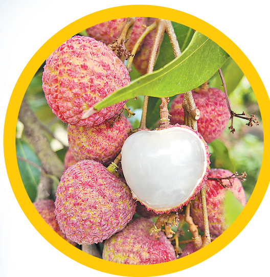
雷岭荔枝