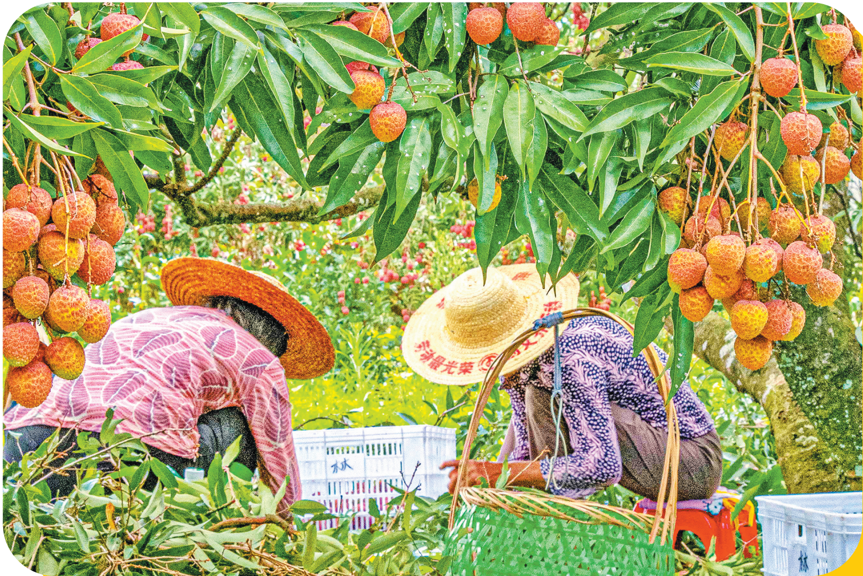
荔枝收成让果农喜笑颜开(资料图)

随着时间进入六月，雷岭的荔枝种植户们也开始迎来一年中最忙的时候，万亩荔林在晚风中摇曳，枝头的鲜果慢慢由绿转红，今年，4.4万亩的雷岭荔枝预计产量在1.5万吨以上，分外甜蜜的收获让雷岭果农们喜笑颜开。山林间，“一颗果实激活一方经济”的乡村振兴样本也在悄然谱写。