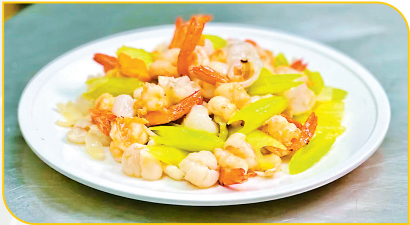
“粤菜师傅”名厨将雷岭荔枝做成鲜荔枝虾球(资料图)

目前，雷岭荔枝种植面积4.4万亩，除了乌叶（黑叶）、桂味、糯米糍等常驻“主角”外，雷岭又通过高接换种技术优化品种结构，接连培育了冰荔、巨美人、仙进奉、井冈红糯等优新品种，新增优新品种种植面积超5000亩，形成传统品种与新品种互补的格局，让雷岭荔枝产业在传承与创新中焕发新活力。