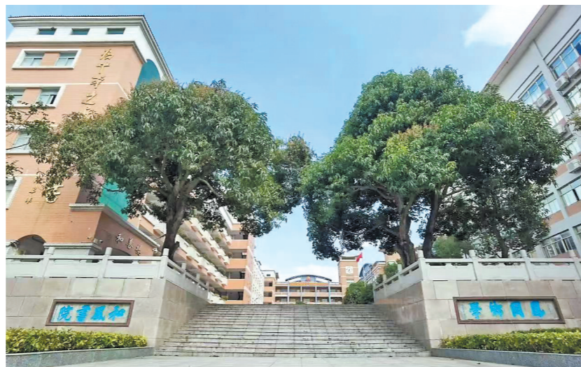
和风中学 谢小庭供图