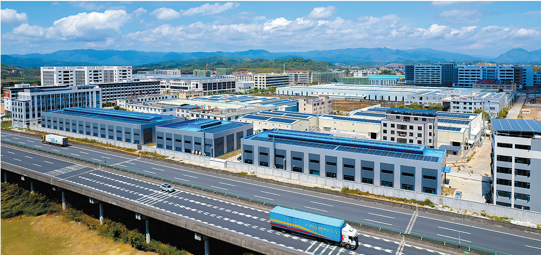
揭西县产业园区区位优势明显

揭西电线电缆产业的高质量发展，正是揭阳市五金机电产业转型升级的生动写照。近年来，揭阳市以技术改造和数字化转型为抓手，全力推动五金机电产业转型升级；共争取并下达省级专项资金1269.66万元，支持巨轮智能等4个五金机电企业技术改造；精准开展政策宣传和申报指导，推动12个五金机电企业技术改造；推进五金机电产业加快技术改造升级；利用省级中小企业数字化转型试点契机，聚焦日用五金、装备制造等细分行业发展需求，打造一批“小快轻准”的数字化解决方案和产品，遴选出3家牵引单位，38项数字化转型产品，支持五金机电企业实施数字化转型。日星机械公司运用“机器人+数控平台”，实现工单派发、零件配送、