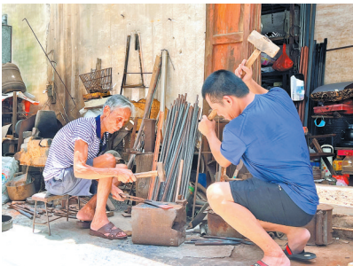
←揭西棉湖打铁街作坊群的制刀匠人

物料仓储全过程智能化管理，数字工厂初见成效；广东佳焊科技实施不锈钢板压延加工提产增效技术改造项目，成功实现了超薄精密不锈钢板的量产，填补了行业内空白；汇宝昌微电机及配件高效自动化生产线技术改造项目将生产能力提升66.67%，生产效率提升30%，达到年产1亿个微电机及配件的规模。