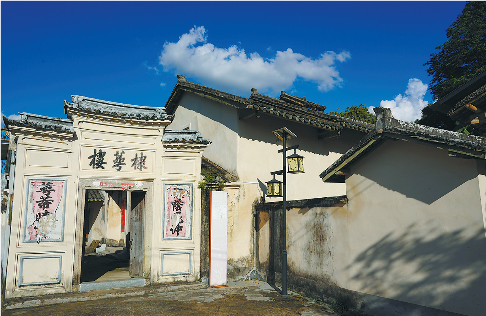
李树化故居“棣棠楼”位于梅县区程江镇大塘村