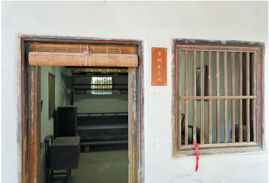
李树化曾居住过的房间