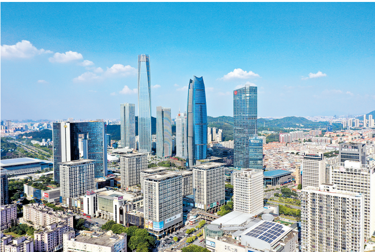
东莞着力营造干净整洁、健康有序、文明靓丽的城市新貌