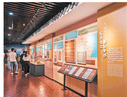
惠州养生文化源远流长,底蕴深厚