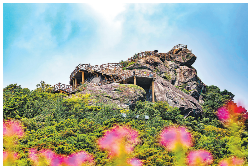
罗浮山是名副其实的天然氧吧。在这里登山徒步,每一次深呼吸都是心灵的洗涤

沿线丰富的文旅资源也催生了蓬勃发展的乡村酒店(民宿),为冬日康养提供了多元的栖居选择。无论是过云山居的湖山意境、山夏1368的明清格调、兰门民宿的乡村风情,还是裸心谷、泊心云舍、西坡、未迟、爱树南秘境、花溪雨等都颇具特色,能够满足游客在静谧舒适中真正实现身心归隐。