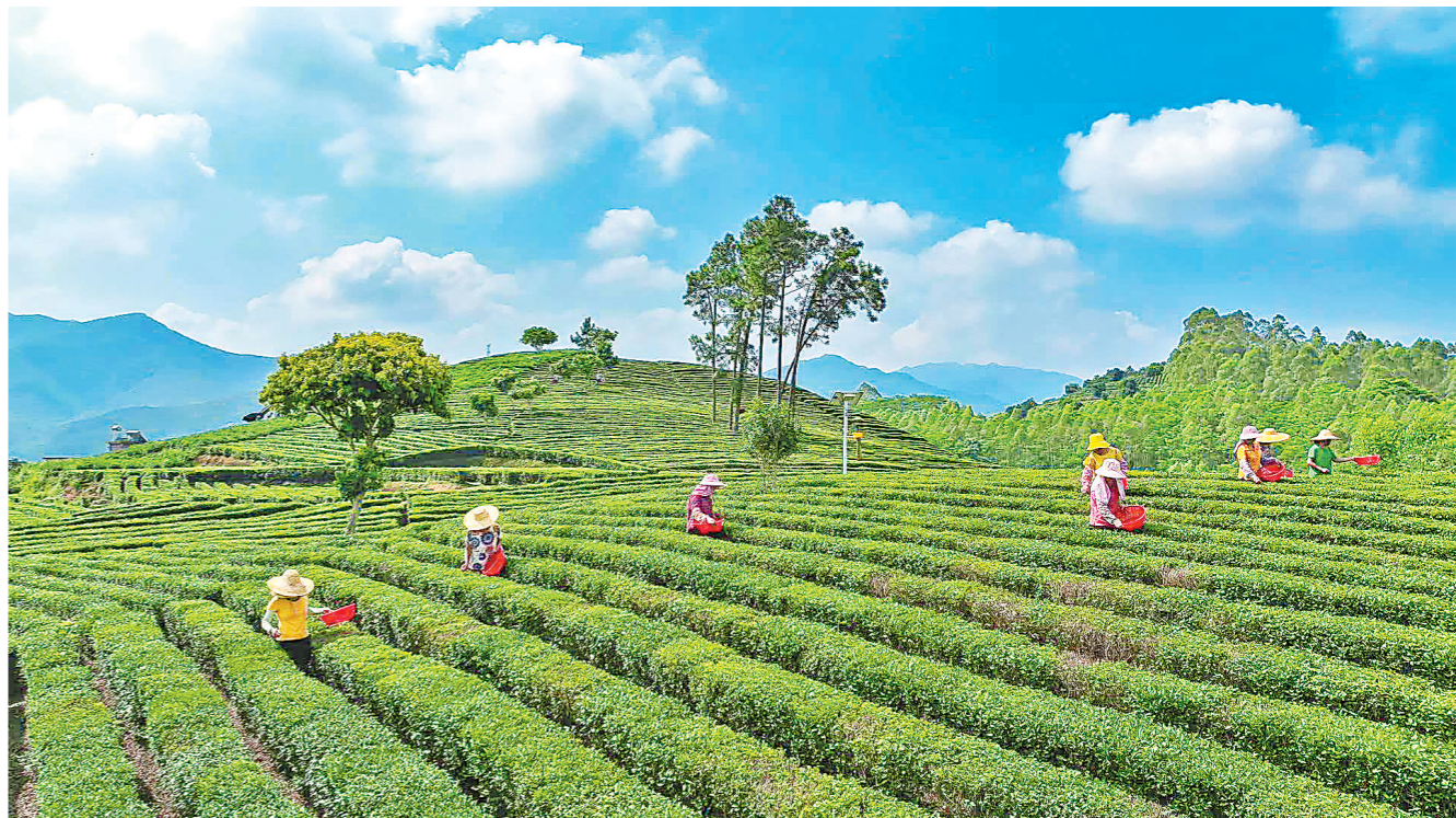
得天独厚的水土滋养出茶叶的独特韵味。漫步万亩茶园,层层叠叠的茶垄如绿色波浪,空气中弥漫着清新的茶香