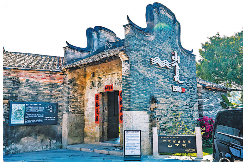
惠州乡村酒店(民宿)百花齐放,各具特色,满足游客多元化度假需求